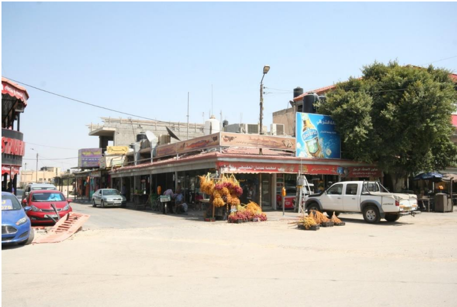
Dit is het centrum van Jericho, gefotografeerd op z'n voordeligst